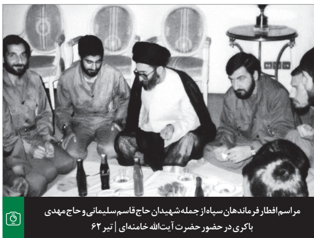
مراسم افطار فرماندهان سپاه از جمله شهیدان حاج قاسم سلیمانی و حاج مهدی باکری در حضور حضرت آیت‌الله خامنه‌ای | تیر ۶۲

که در آنجا سفره‌ای که پهن کرده است قرآن مجید است و محلی که در آنجا ضیافت می‌کند مهمش «لیلة القدر» است و ضیافتی که می‌کند ضیافت تنزیهی و ضیافت اثباتی و تعلیمی است. نفوس را از روز اول ماه مبارک رمضان به روزه، به مجاهده، به